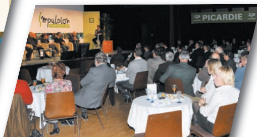
Le public nombreux a été très attentif au débat sur les tables rondes.