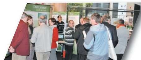
Les personnalités comme le public ont pu parcourir le village des rencontres

La troisième édition des rencontres régionales des loisirs et sports de nature s'est déroulée le 3 décembre dernier dans les locaux de la Faïencerie à Creil. Près de 150 personnes ont assisté à cette journée : des acteurs des loisirs et des sports de nature, du tourisme, de la protection et de la sensibilisation à l'environnement et des représentants politiques. Retrouver l'ensemble des présentations des intervenants et les photos sur : http://picardie.franceolympique.com .