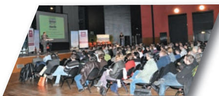
Un public nombreux avait répondu présent pour la 3 ème édition des rencontres