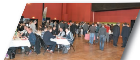
Le repas était également dans la thématique « Développement Durable »