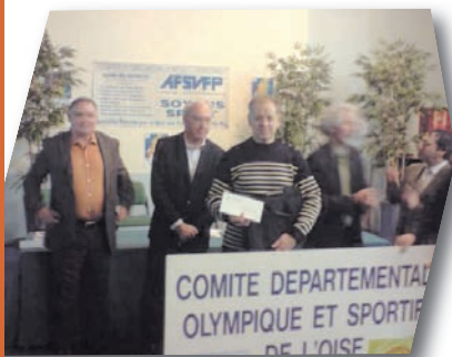
1 er prix du Challenge Fair-Play 2009

Pour la 1 ère année, le CDOS60 a pris l'initiative d'organiser un séminaire à destination des présidents de comités isariens. Le samedi 12 décembre près de 40 personnes provenant de 20 comités sportifs se sont réunies pour débattre de l'avenir du sport dans l'Oise. En effet, la thématique ciblait l'actualité avec la mutation des collectivités territoriales et des services de l'Etat. L'ancienne DDJS nommée aujourd'hui DDCS (Direction Départementale de la Cohésion Sociale) est intervenue pour effectuer un point sur les réformes en cours et évoquer les enjeux pour le mouvement sportif sur notre département.